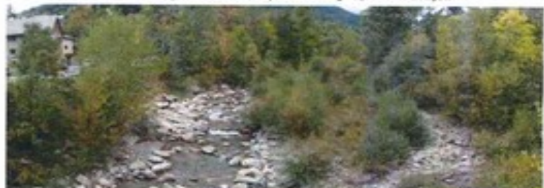
Isle en amont du pont de Villars - octobre 2013

La Chasse prend sa source au pied du massif de Caduc et draine de nombreux affluents en zone d'alpages avant d'entrer dans une vallée encaissée. En aval du hameau de Chasse, le cours d'eau emprunte des gorges rocheuses jusqu'au pont-gué, avant de traverser le village de Villars-Colmars et de rejoindre le Verdón.