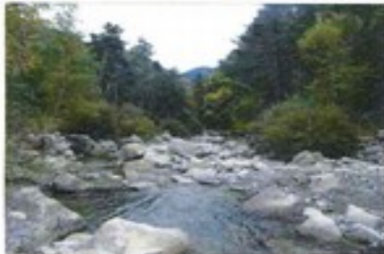
Ripisylve de la Chasse en aval du pont-gué