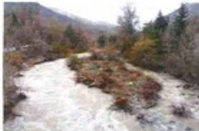
Isle amont pont de Villars - crue printemps 2013