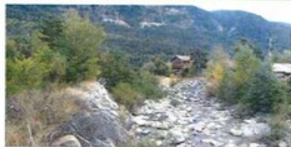
Végétalisation de l'espace intra-digues, aval du tronçon